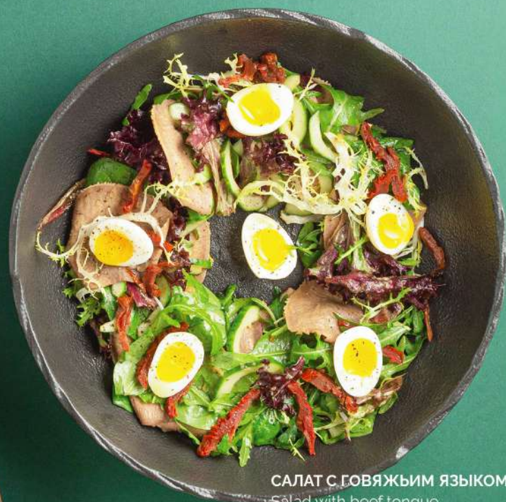
САЛАТ С ГОВЯЖЬИМ ЯЗЫКОМ Salad with beef tongue